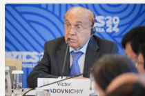
Президент РСР ректор МГУ Виктор Садовничай Москва, 29 мая 2024 г.

«Российский Союз ректоров едет работу по созданию рейтинга университетов страны «ТРИ МИССИИ» на платформе международного рейтинга «Три миссии университета». В наше время очень важен честный и комплексный подход к определению качества высшего образования».