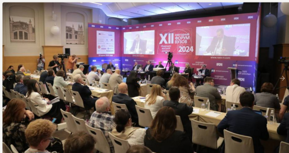
Вышел 13-й рейтинг ста лучших вузов России 19 июня 2024 г.