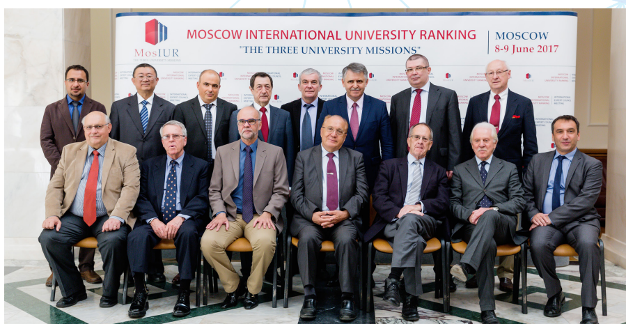
«Три миссии университета», 2017 год

Успех китайских вузов во многом сопряжён с улучшением показателей второй, научной миссии – ростом цитируемости публикаций и увеличения исследовательского бюджета в расчёте на сотрудника. При этом в странах англосаксонского мира (Великобритания, США, Канада, Австралия и др.) эти показатели в среднем несколько снизились. Что же касается вузов Индии, то наибольшего прогресса университеты этой страны добились по показателям третьей миссии – например, число онлайн-курсов выросло в среднем на 34%. Кроме того, Индия входит в топ стран по объёму финансирования университетов в расчёте на студента (по паритету покупательной способности).