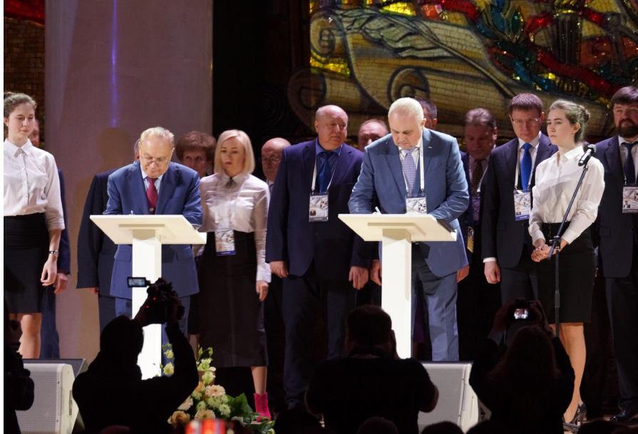
Международный форум «Университеты, общество и будущее человечества». Подписание первых соглашений о создании консорциумов «Вернадский», март, 2019