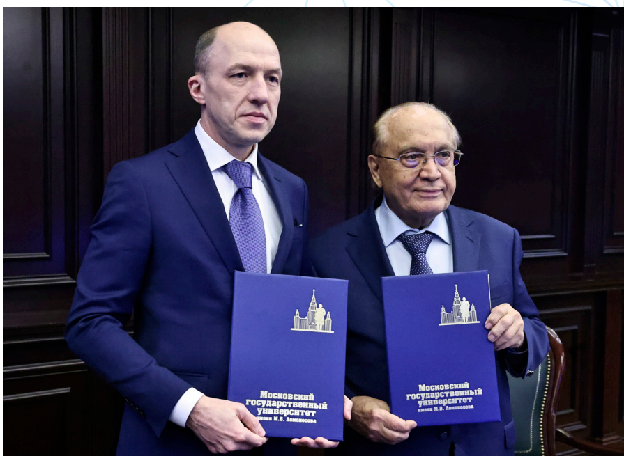
Подписание соглашения об учреждении научно-образовательного консорциума «Вернадский-Горный Алтай». Ноябрь, 2023 год

развитие компетенций участников консорциумов в организации исследовательского процесса и международного научно-образовательного сотрудничества, повышение квалификации руководителей образовательных организаций. Созданы совместные научно-образовательные центры и лаборатории. Консорциумы «Вернадский» также являются площадками для профессионального развития молодежи. Проводятся олимпиад школьников, универсиады, конференции и конкурсы студентов, аспирантов и молодых ученых.